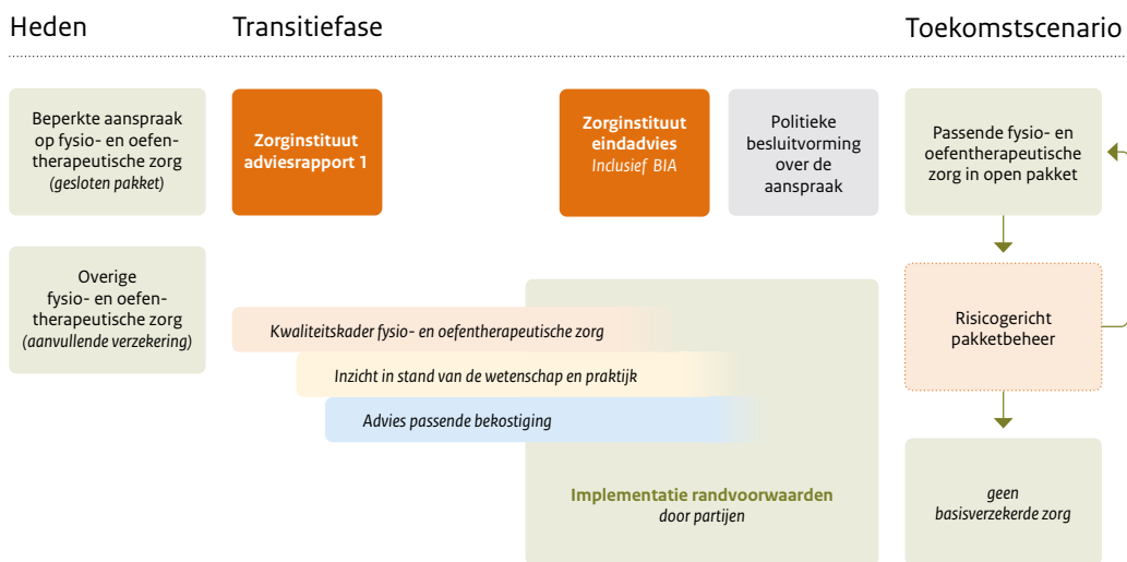
Figuur 3 - Van een gesloten aanspraak naar een open aanspraak

In dit rapport beschrijven we de voorgestelde programmalijn om te komen tot een open aanspraak voor passende fysio- en oefentherapeutische zorg. De programmalijn omvat drie randvoorwaarden voor kwaliteit, pakketbeheer en passende bekostiging. Figuur 3 is een weergave van de programmalijn waarin partijen in samenspel de beoogde overgang maken van een gesloten aanspraak naar een open aanspraak.