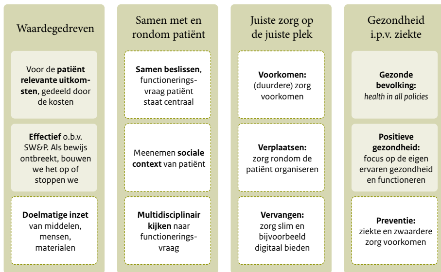
Figuur 1 | Uitwerking van de vier principes van passende zorg op onderdelen van passende organisatie van zorg voor mensen met kanker